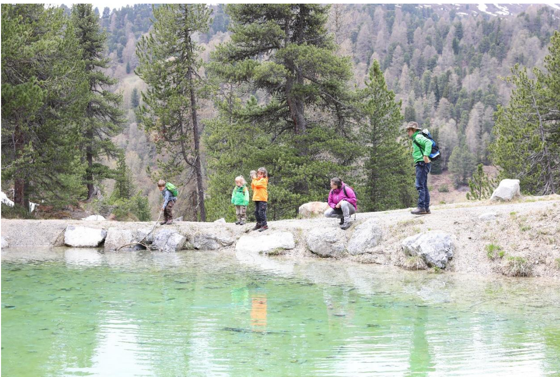
Bei kühlem Wetter rings um den türkisblauen Bergsee bei der Alp Champatsch spielen und forschen, in der Sommerhitze die Füße erfrischen.