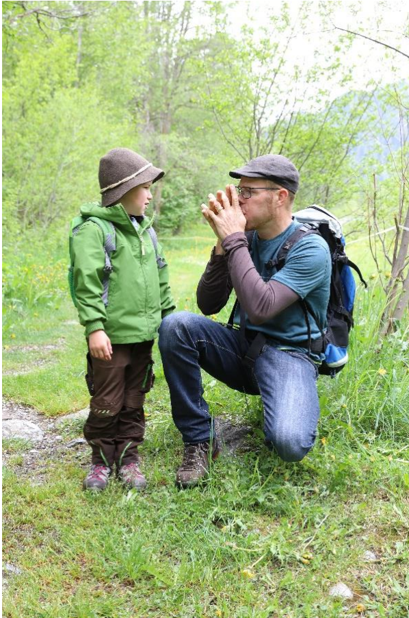
Wer pfeift mit einem Grashalm lauter als die Vögel im Auenwald?